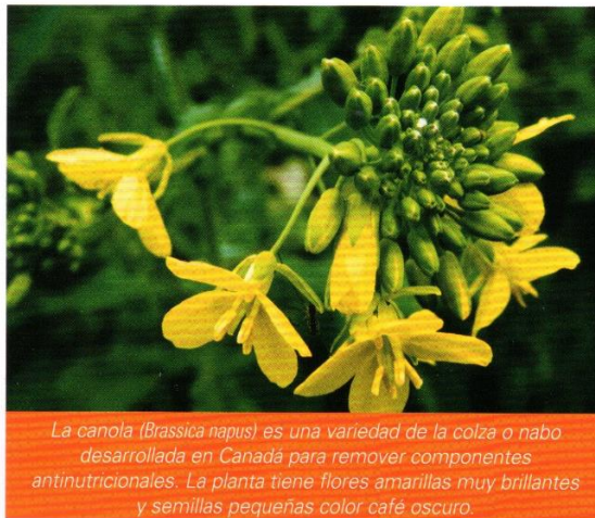
La canola ( Brassica napus ) es una variedad de la colza o nabo desarrollada en Canadá para remover componentes antinutricionales. La planta tiene flores amarillas muy brillantes y semillas pequeñas color café oscuro.

Las grasas se procesan de diferente manera, de tal manera que el tipo de grasa es más importante que la cantidad. El aceite de canola es apreciado tanto por lo que sí contiene (grasas mono y poliinsaturadas) y por lo que no (grasas saturadas y trans). Tiene el menor porcentaje de grasa saturada (7%) - la mitad de lo que contienen los aceites de oliva, soya y maíz - y buen porcentaje de ácidos grasos Omega 3 (11%). El aceite de canola también tiene un alto contenido en grasa monoinsaturada (61%) y es una buena fuente de vitaminas E y K. Tiene cero grasas trans y por ser de origen vegetal, no contiene colesterol.