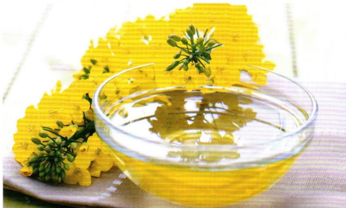
El aceite de canola es ideal para la cocina mexicana ya que no transfiere sabor a ingredientes fuertes como los chiles.

micro-moles de glucosinolatos) son muy diferentes. De hecho, existe un estándar internacional para la canola que la distingue de la colza basada en estas diferencias de niveles de ácido erúxico y glucosinolatos.